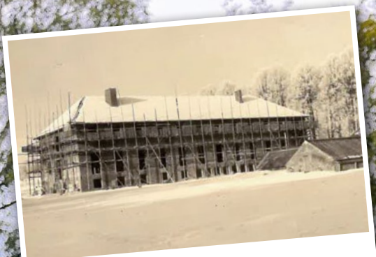
Bettenhaus im Bau